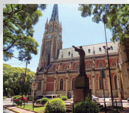
CATEDRAL SAN ISIDRO